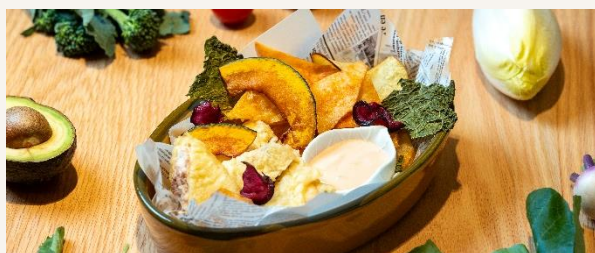
フィッシュ&ベジタブルチップ