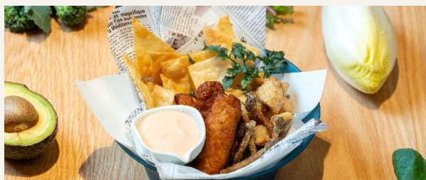
福岡県三浦郡大木町の苺と フライドベジタブルチップス

Mushrooms and Fried Vegetable Chips from Oki Town, Mizuma County, Fukuoka