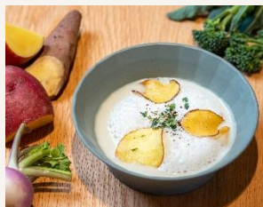
九州産旬野菜のポタージュ Potage of Seasonal Vegetables from Kyushu