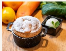
旬野菜を混ぜ込んだココットパンケーキ & 阿蘇のミルクジェラード

Cocotte pancakes mixed with seasonal vegetables & Aso milk gelade