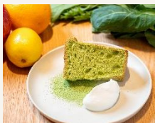
ベジタブルシフォンケーキ クリーム添え