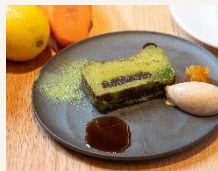
鹿児島県産さつまっチャのバスクチーズケーキ