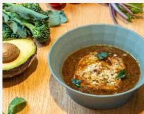
九州産玉葱のオニオンスープ Kyushu Onion Soup